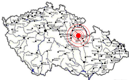
UMÍSTĚNÍ V RÁMCI ČR